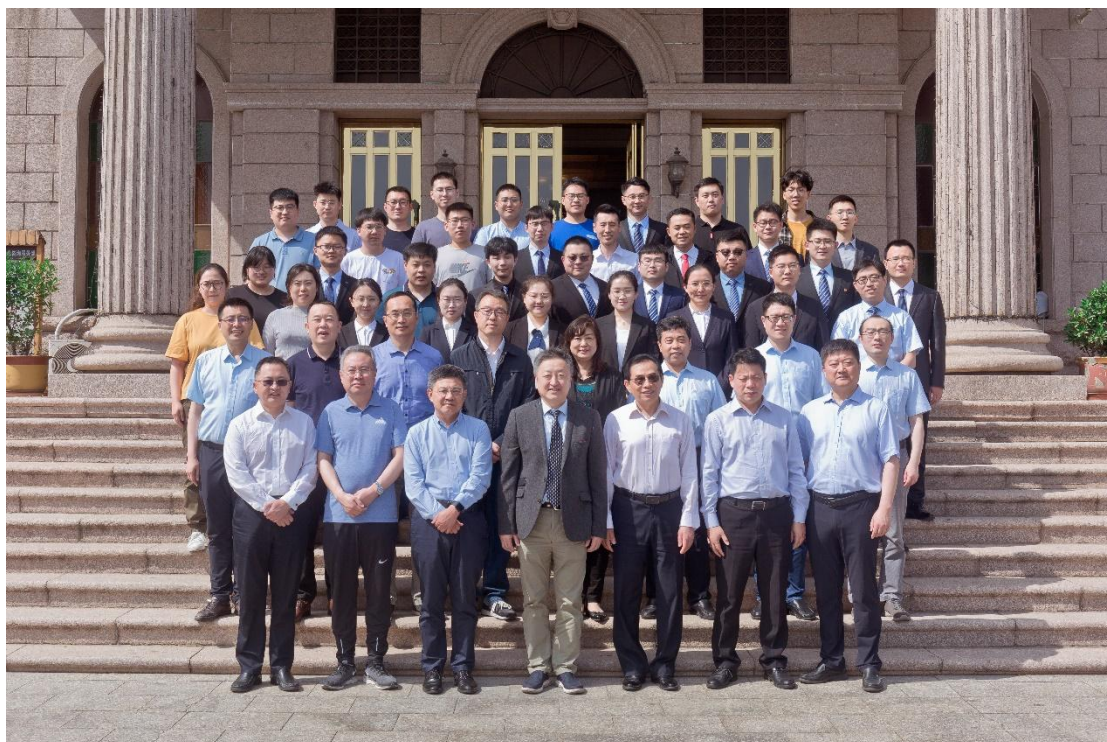
青大附院胃肠外科医师合影留念